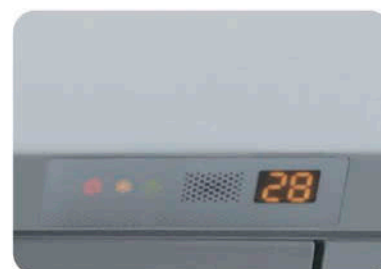
Дисплей на передней панели