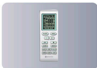
Функциональный пульт ДУ YAM1F